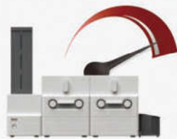
单面部分区域或全部区域彩色打印